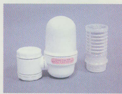
▲本体、左 カートリッジ、右